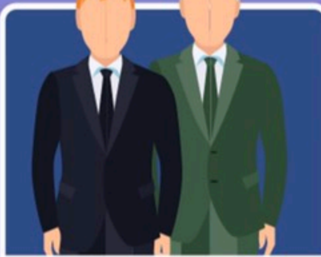
ผู้ดำรงตำแหน่งทางการเมือง