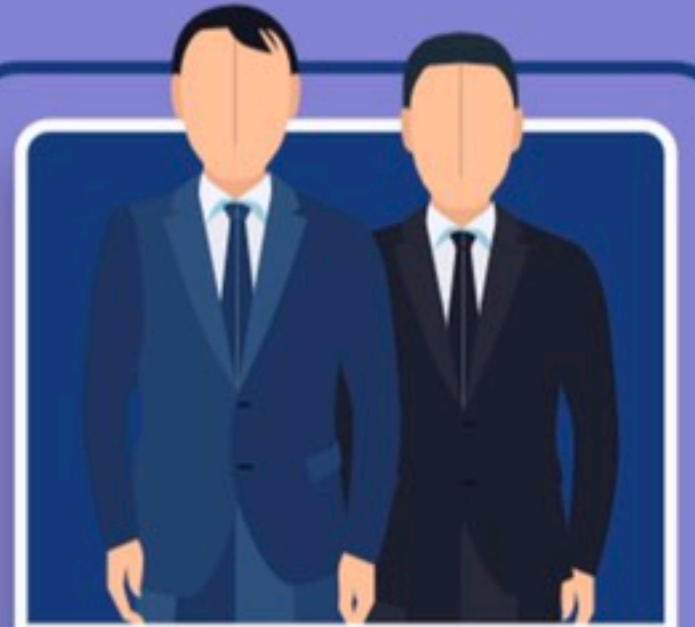
ผู้ดำรงตำแหน่งระดับสูง