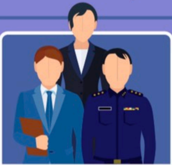
ดำรงตำแหน่งในองค์กรอิสระ

ตำแหน่งของเจ้าพนักงานของรัฐที่ ต้องห้าม! ดำเนินกิจการตามมาตรา 127