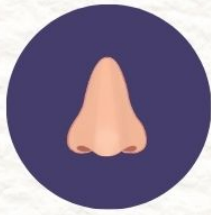
แสบจมูก ไอ มีเสมหะ