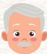
ผู้สูงอายุ