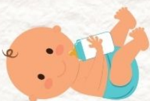
เด็กเล็ก