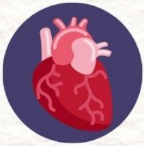
โรคหลอดเลือด หลอดเลือดสมอง หัวใจขาดเลือด