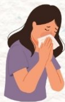
ผู้ที่มีโรคเกี่ยวกับ ทางเดินหายใจ