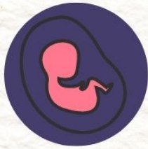
ทารกแรกเกิด มีน้ำหนักน้อยกว่าปกติ