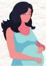
หญิงตั้งครรภ์