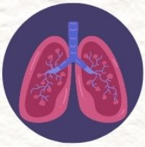
มะเร็งปอด