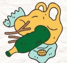
ไม่เผาขยะ เเผาป่า หรือพืชผลทางการเกษตร