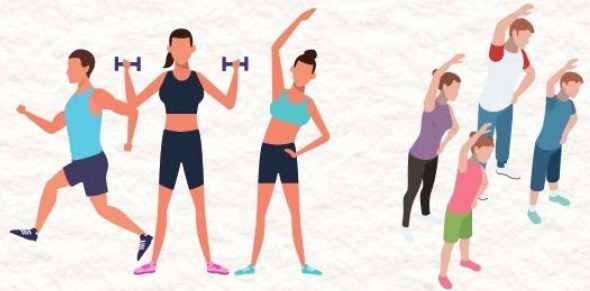
เลี่ยงกิจกรรมกลางแจ้ง ในช่วงที่มีฝุ่นเกินมาตรฐาน